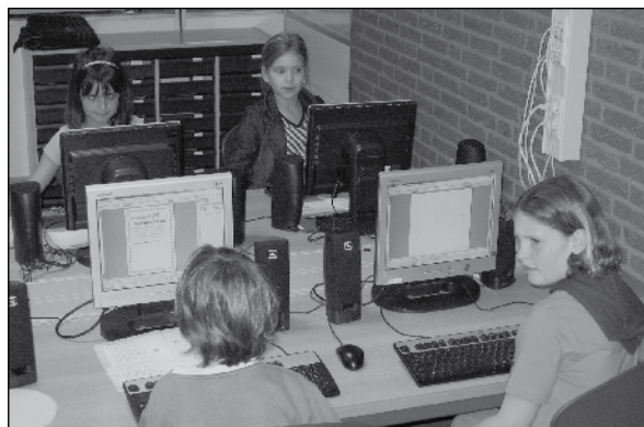
Computergebruik is een vast onderdeel van ons onderwijs.

De school zal overtredingen zonder uitzondering serieus nemen. Herhaald of ernstig misbruik leidt tot ontzegging van de toegang tot het netwerk. Het reglement ligt voor betrokkenen steeds op school ter inzage.