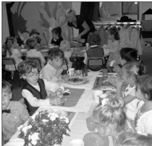
Feestvieren hoort ook bij school