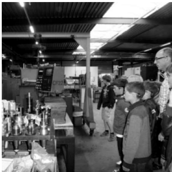
Een excursie naar een machinefabriek als onderdeel van techniek.

De belangrijkste resultaten voor onze school: