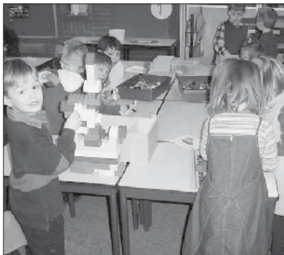
Kleuters leren spelenderwijs. Het leerproces wordt door de leerkracht nauwkeurig bijgehouden. Ouders worden hierover geïnformeerd door de leerkrachten.