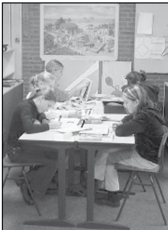
In groep 8 werken de kinderen zelfstandig aan hun weekopdrachten.

Er zijn in deze regio veel instellingen die zich inzetten voor het welzijn van kinderen. Soms weten deze instellingen niet van elkaar wie wát doet. Leerkrachten, hulpverleners en begeleiders moeten in een oogopslag kunnen zien wie contact heeft met uw kind in geval van problemen. Zo kunnen zij snel met elkaar overleggen. De verwijsindex zorgt ervoor dat mensen van elkaar weten welke hulp een kind krijgt. VIP zorgt voor vroegtijdige signalering van problemen bij jeugd en dat op tijd hulp aanwezig is. Ook zorgt VIP voor overzicht, samenwerking en goede afspraken tussen de verschillende instellingen. Samenwerking is nodig omdat dan de problemen van het kind pas echt goed worden aangepakt.