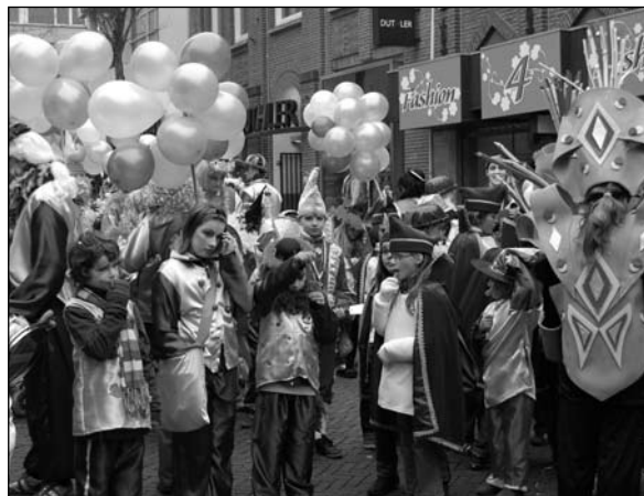
Windekind is jaarlijks prominent aanwezig tijdens de Kinderoptocht

In onze schoolkalender staan alle belangrijke namen en adressen.