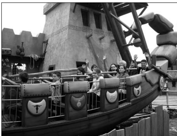
Schoolreis in Toverland.

Deze grafiek geeft een globale indicatie; de landelijke score bevindt zich elk jaar tussen 535 en 536; we zitten daar dus elk jaar ruimschoots boven