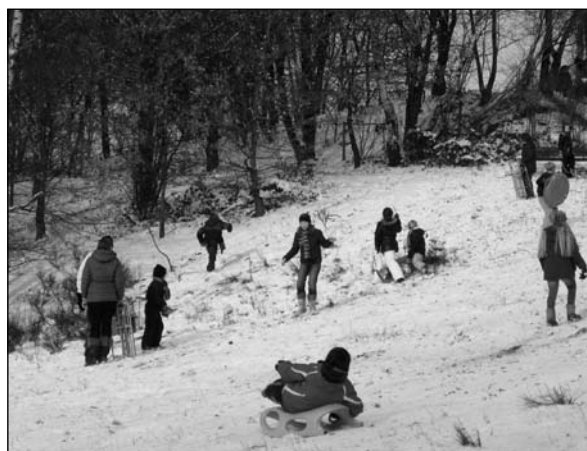
Deze alternatieve gymles wordt zeer gewaardeerd

Na afloop van de lessen vinden regelmatig door school ondersteunde activiteiten plaats zoals typelessen, kinderdans, gastlessen van Mad Science, sportactiviteiten georganiseerd door Alkander etc. Ouders c.q. verzorgers bepalen zelf in welke mate ze hun kind(eren) hieraan laten deelnemen. Hetzelfde geldt ten aanzien van het nemen van een abonnement op een of meerdere jeugdtijdschriften, of het bestellen van schoolfoto's.