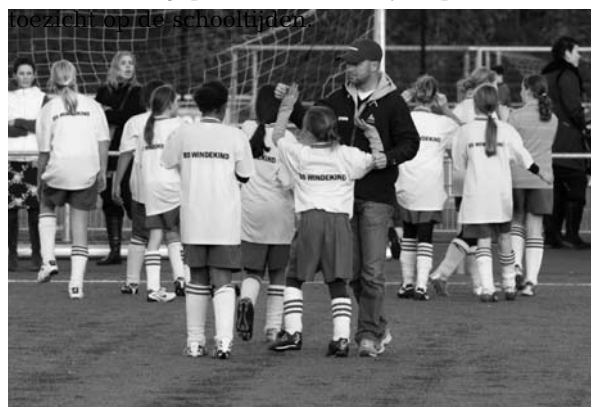
Ook op het voetbalveld staan onze meiden hun "mannetje"

De oudergeleding van de MR heeft instemming bij het vaststellen of wijzigen van de schooltijden. Een wijziging kan pas plaatsvinden als de mening van alle ouders is gepeild. De onderwijsinspectie houdt