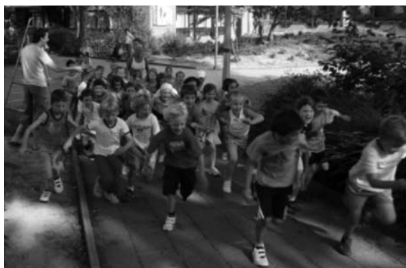
Leerlingen van start voor de sponsorloop 'Be More'.

Het leerlingdossier bevat observaties, rapporten, uitslagen van toetsresultaten, gegevens uit het leerling- en onderwijsvolgsysteem (LOVS), verslagen van gesprekken met ouders en afspraken die er over de leerling zijn gemaakt. De verwerking dient alleen voor de organisatie of het geven van onderwijs en de begeleiding van de leerling. Het onderwijs valt onder het Vrijstellingsbesluit, dat onderdeel uitmaakt van de Wet Bescherming Persoonsregistratie. Hiermee is geregeld dat er meer gegevens dan enkel de persoonsgegevens mogen worden bewaard. Deze gegevens worden op een deugdelijke wijze bewaard. Ook gegevens uit deze administratie worden slechts na toestemming van de ouders aan derden verstrekt. Ouders mogen het leerling-dossier niet meenemen buiten de school. Ten aanzien van collega scholen worden dezelfde richtlijnen gehanteerd. Zonder toestemming van ouder(s) mag het dossier niet worden ingezien en verstrekt. De school voldoet aan de eisen die de Wet Bescherming Persoonsgegevens stelt. Voor meer informatie zie: www.innovo.nl .