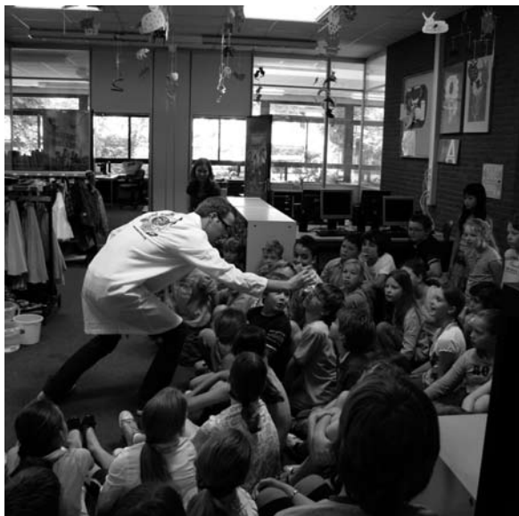
Mad Science: de verwondering bij techniekonderwijs.