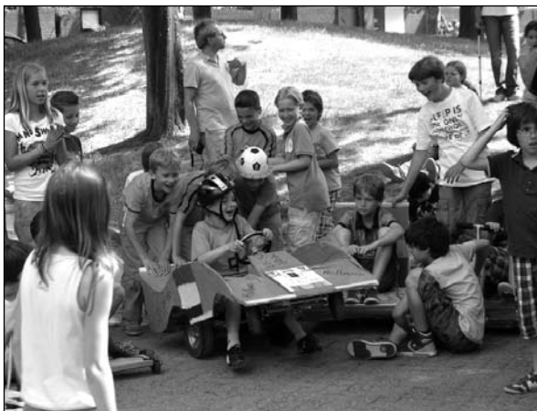
De zeepkistenrace vormt elk jaar het hoogtepunt van het schoolfeest.

Een verzoek om verlof van meer dan tien schooldagen per jaar zal via de directeur aan de leerplichtambtenaar worden voorgelegd. Dit moet zo snel mogelijk worden aangevraagd.