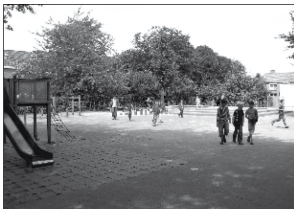
Er zijn gescheiden speelplaatsen voor onderbouw en bovenbouw.

Om te onderstrepen dat we aan goede communicatie hechten en om de communicatie met alle betrokken zo goed mogelijk te laten verlopen, is voor onze school een communicatieplan opgesteld. Het geeft in hoofdlijnen weer wat, wanneer, hoe en met wie gecommuniceerd wordt. In het communicatieplan schetst ook de procedures die bij informatieverstrekking aan formele partners gehanteerd (moeten) worden.