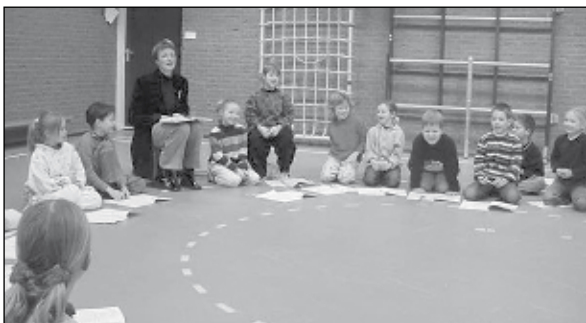
De vakleerkracht voor muziek werkt met alle leeftijdsgroepen. Daarbij wordt ook gebruik gemaakt van de speelzaal.

Wanneer een kind door ziekte (langdurig) de school niet kan bezoeken, kan toch het onderwijsproces worden voortgezet. Dat is belangrijk om leerachterstanden zoveel mogelijk te voorkomen en sociale contacten in stand te houden. De school kan hiervoor externe hulp inroepen.