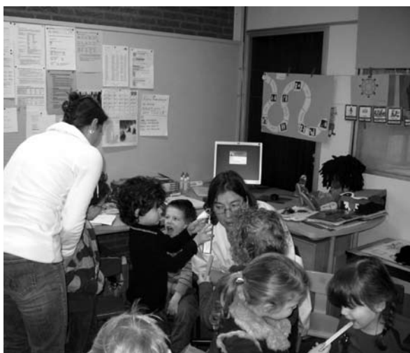
Een gastles door een "echte" dokter is een vorm van ouderparticipatie die erg aanspreekt