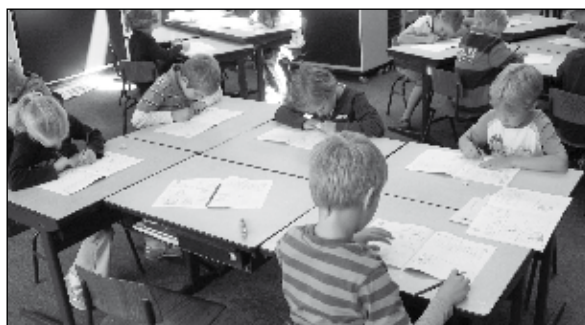
Door het formeren van tafelgroepjes kunnen kinderen gemakkelijk met elkaar samenwerken

Wij plaatsen deze activiteiten onder de noemer "coöperatief leren".